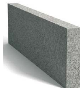
Tablica 1. Wymiary obrzeży.