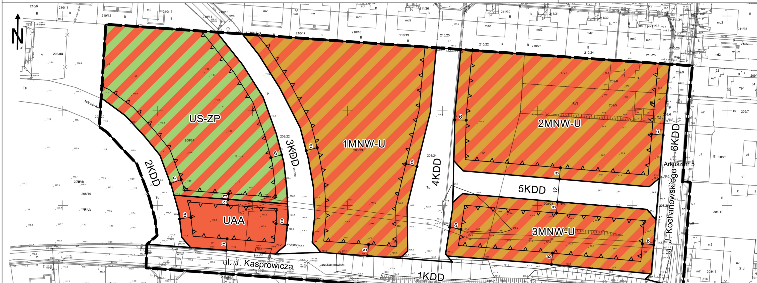
Wrys z Studium uwarunkowań i kierunków zagospodarowania przestrzennego miasta i gminy Gostyń skala 1:10 000

Załącznik nr 1A do Uchwały nr...../...../2023 Rady Miejskiej w Gostyniu z dnia .....r.