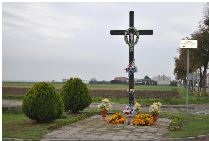
Miejsce kultu religijnego