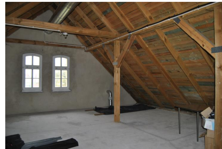
Poddasze sali wiejskiej