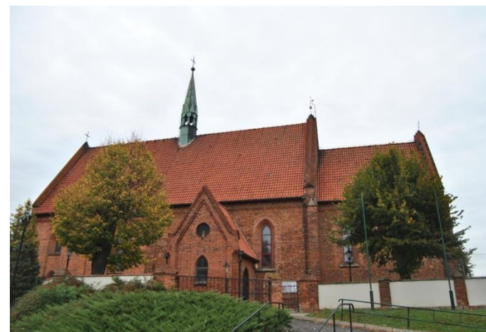
Kościół pw. św. Marcina