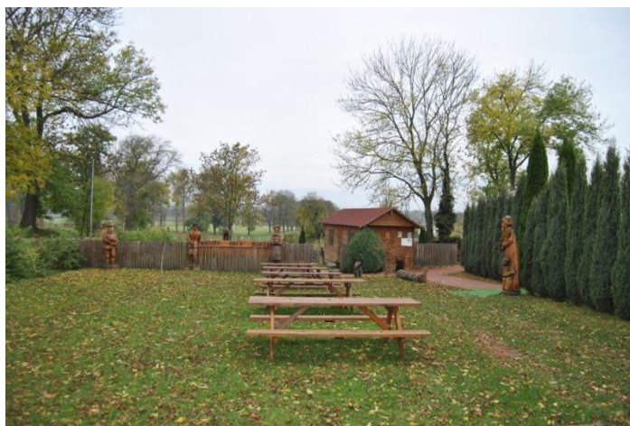
Kraina Orla Białego