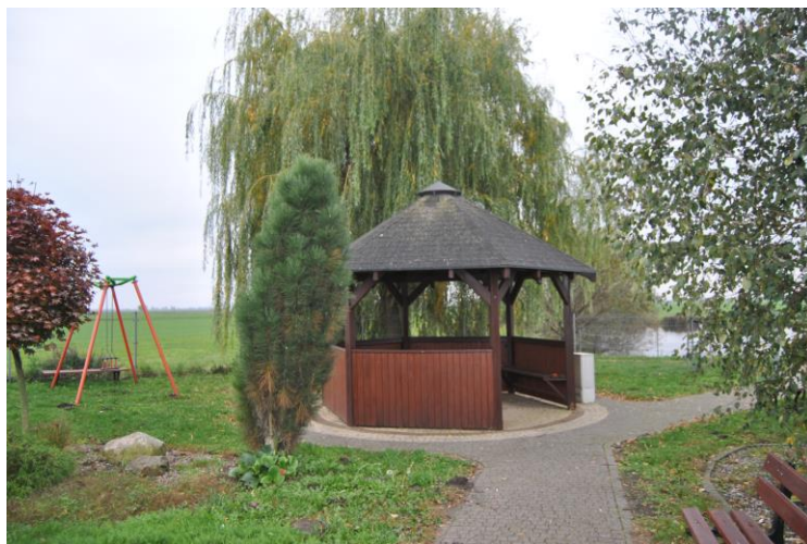
Teren rekreacyjny przy stawie