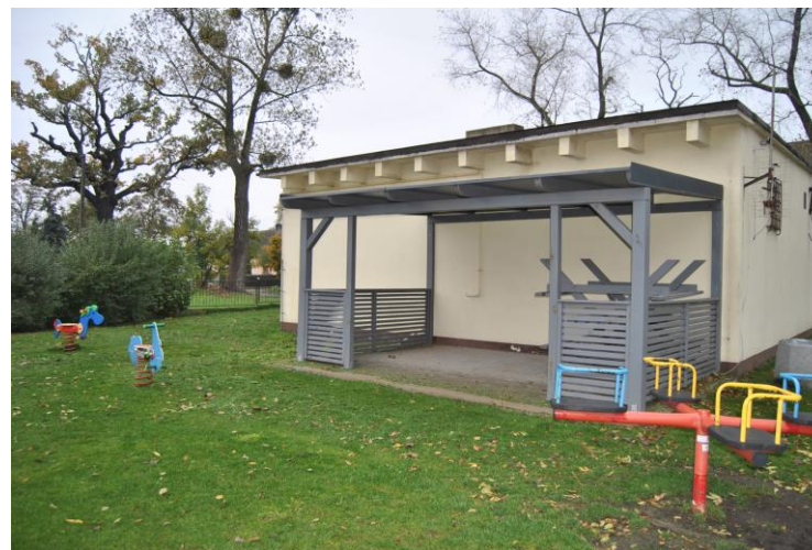
Teren rekreacyjny za salą wiejską