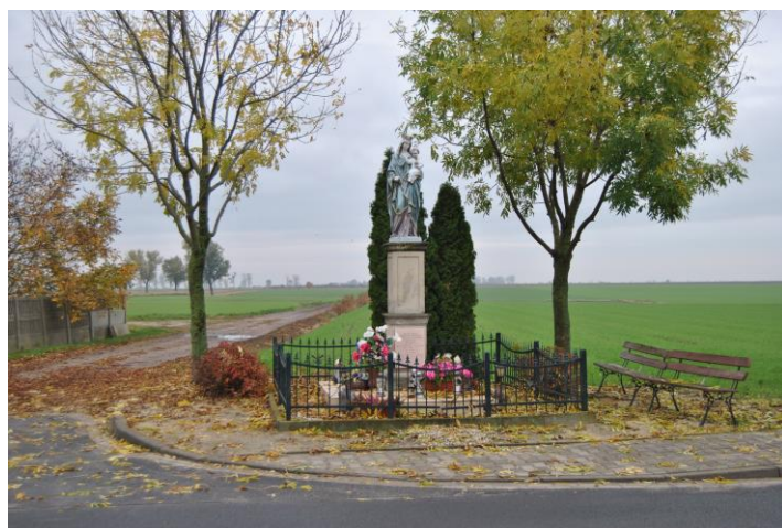
Miejsce kultu religijnego